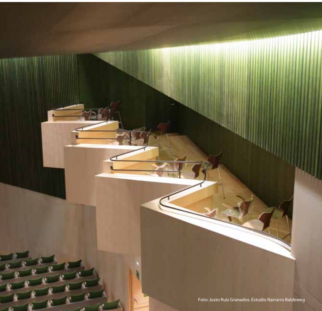
Estudio Narrarro Baldeweg